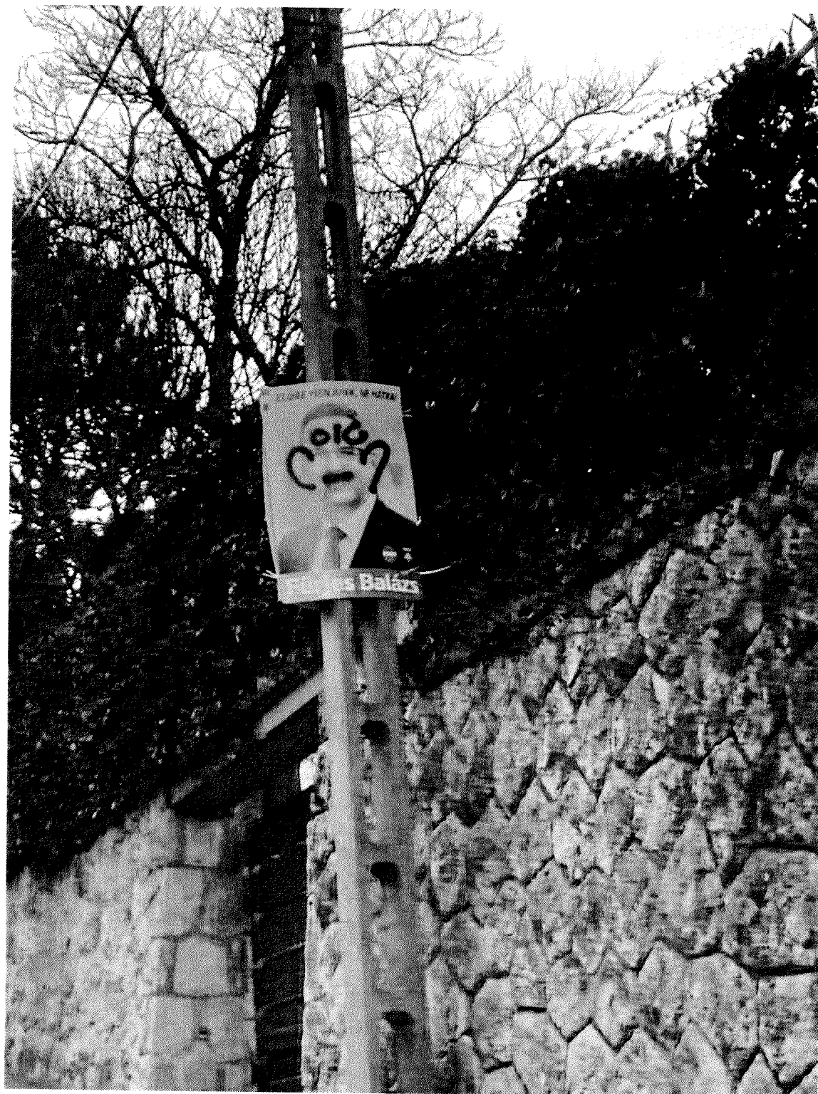
Kútvölgyi út (2)