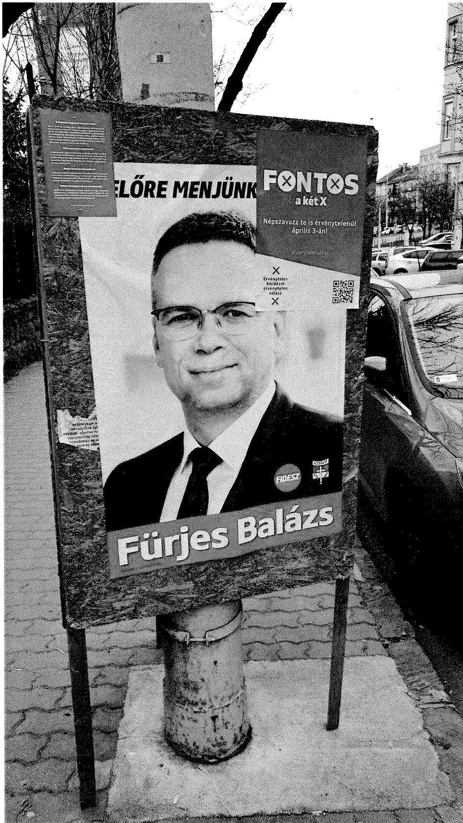
Királyhágó u. 3. (1)