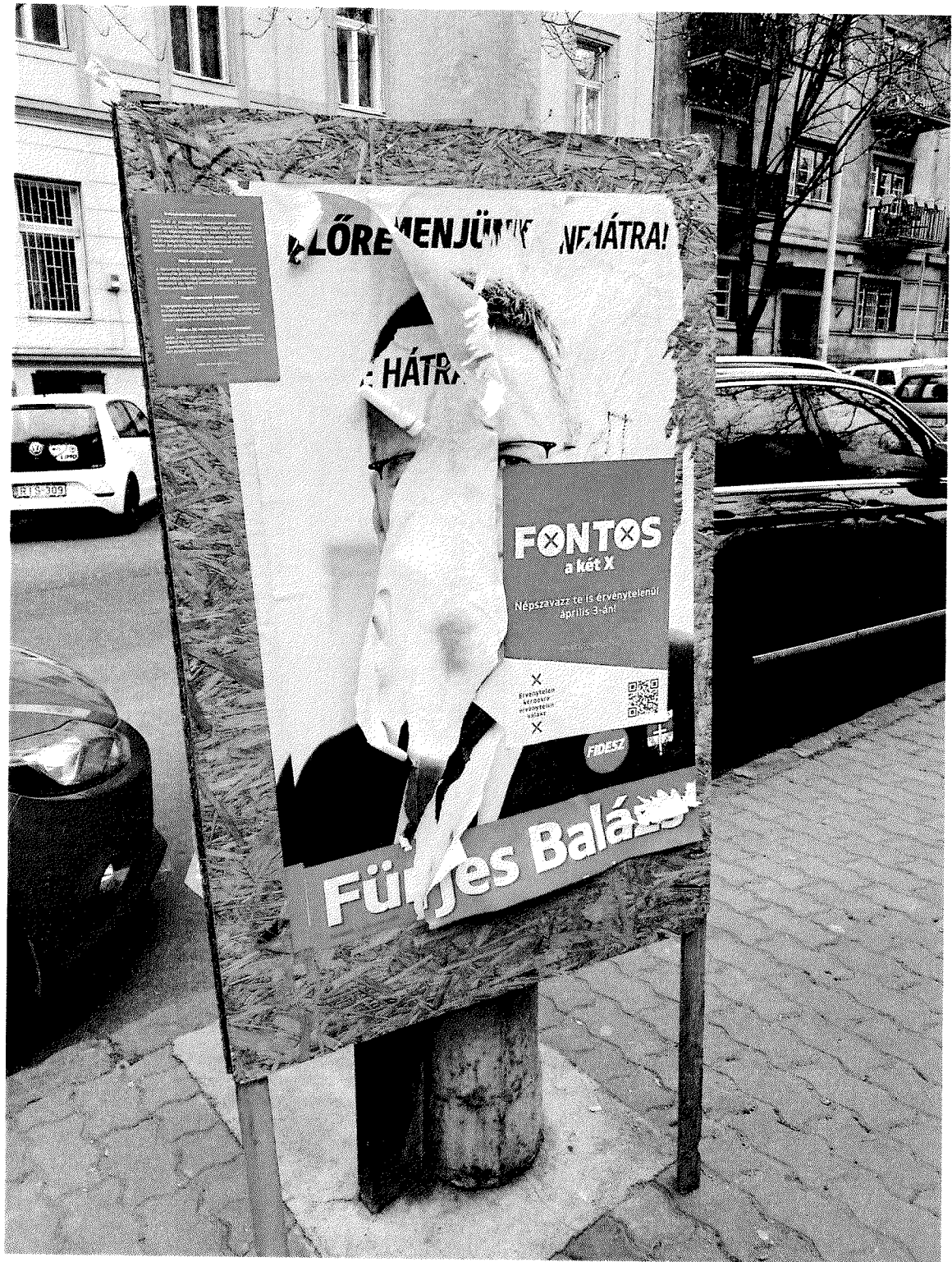
Királyhágó u. 3. (2)