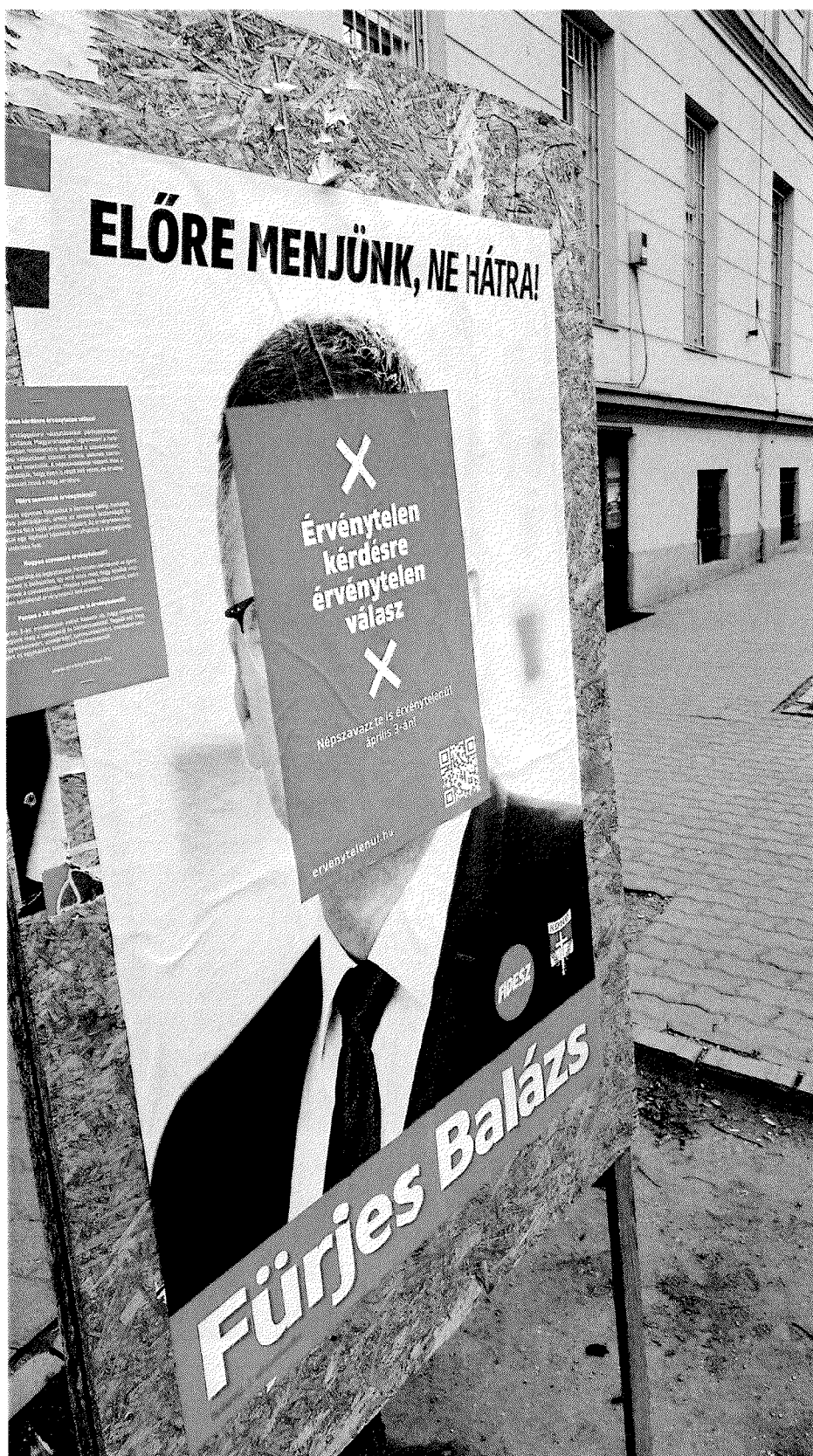
Királyhágó u. 2.