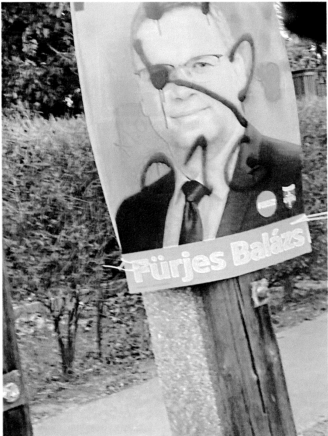
Kút völgyi út (1)