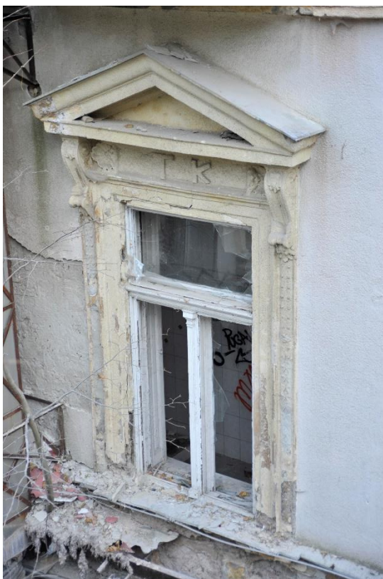
17. kép Ablakkeretezés