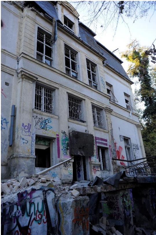
2. kép Északi homlokzat, részlet