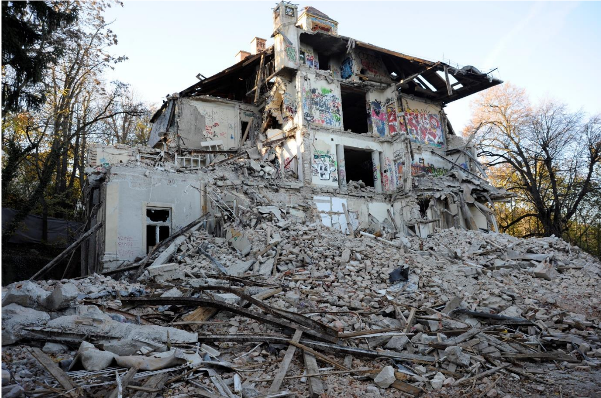
1. kép Az épület kelet felől, összkép