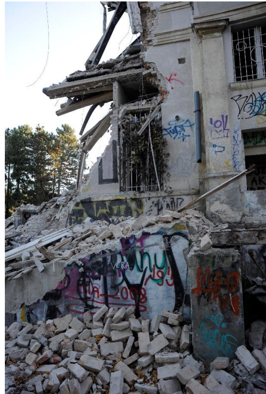
3. kép Északi homlokzat, részlet