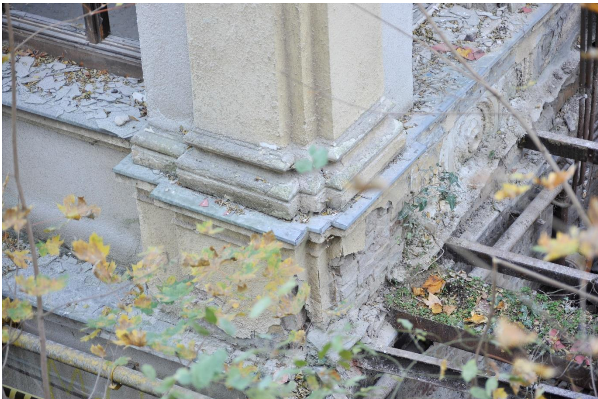
16. kép Az előző pilaszterek podesztje