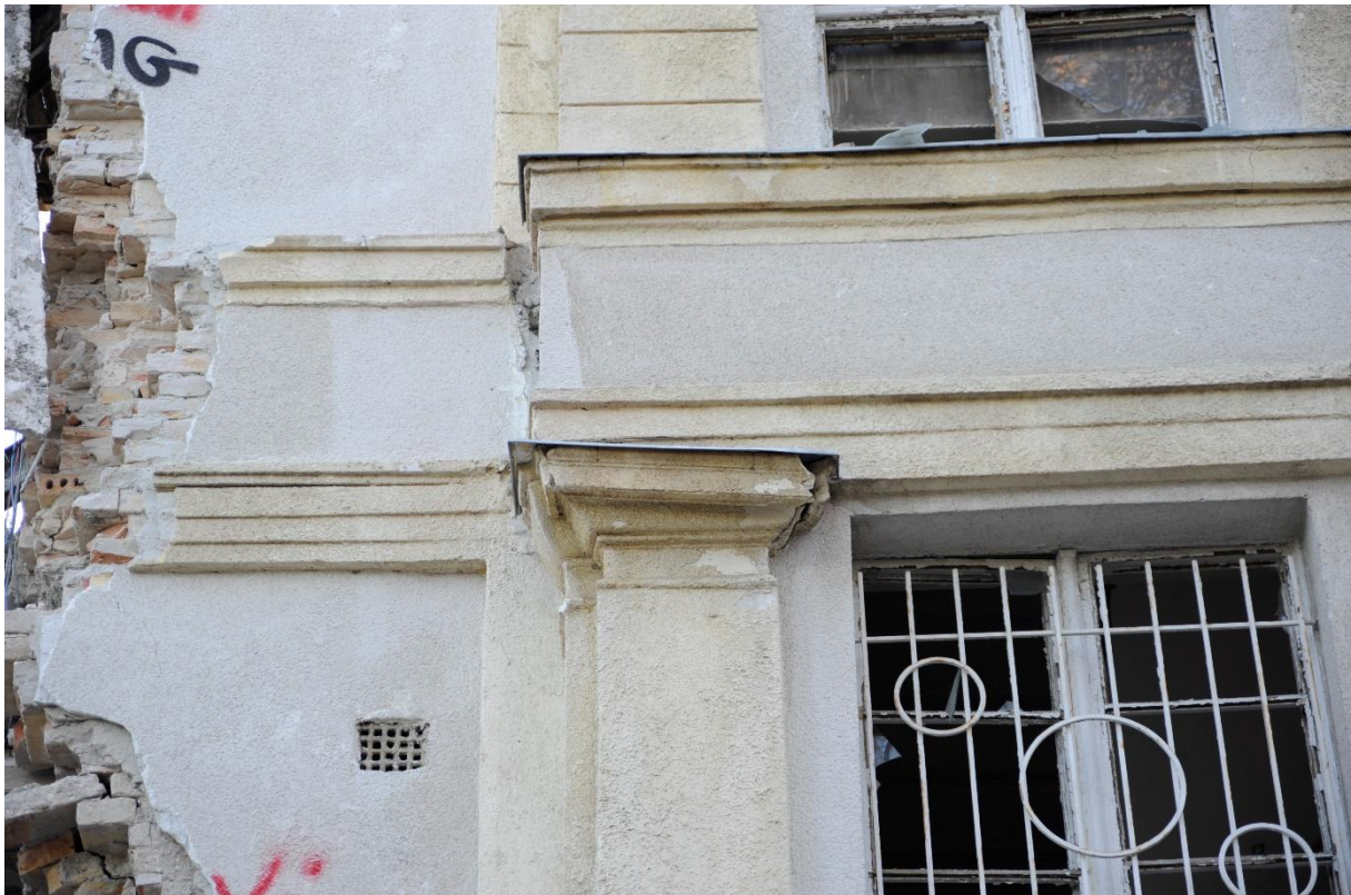
4. kép Pilaszter és osztópárkány az északi homlokzaton