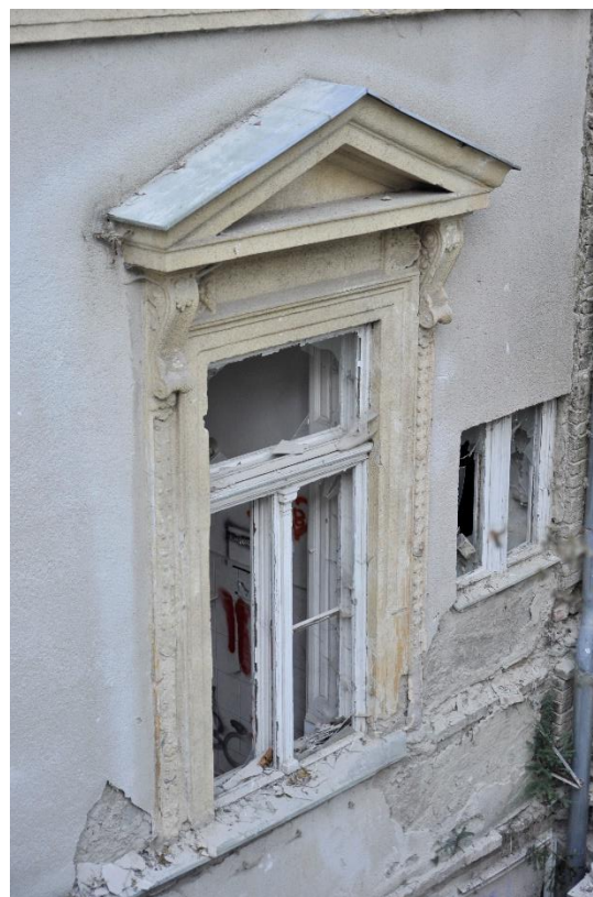
18. kép Ablakkeretezés