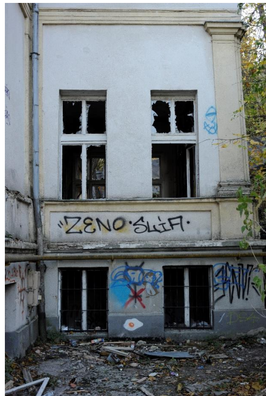
6. kép Az északi homlokzat nyugati részének részlete