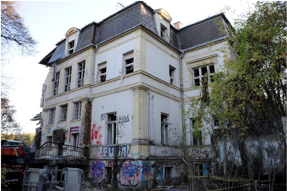
10. kép Északi homlokzat, összkép