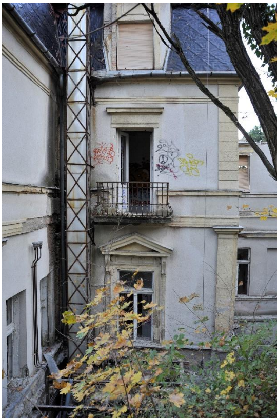
13. kép Nyugati homlokzat déli szakasza