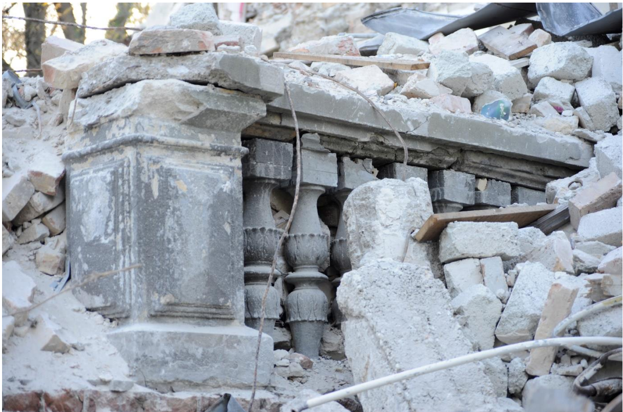
11. kép A romok alól kilátszó mészkő balusztrád