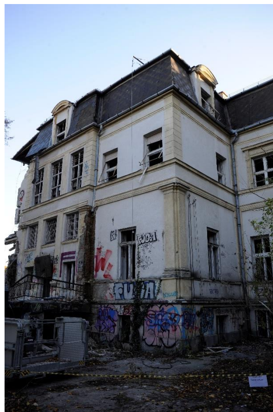
9. kép Északi homlokzat, összkép