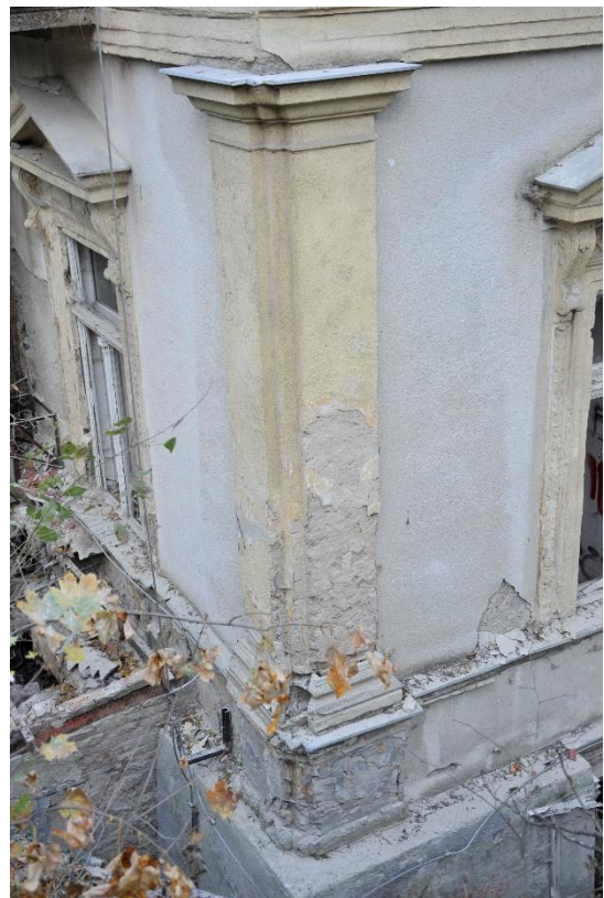
15. kép Sarokpilaszterek az épület délnyugati sarkán