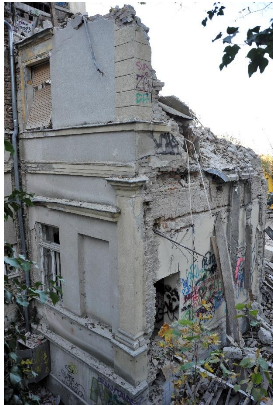
14. kép Az épület déli és nyugati homlokzata, sarokrész