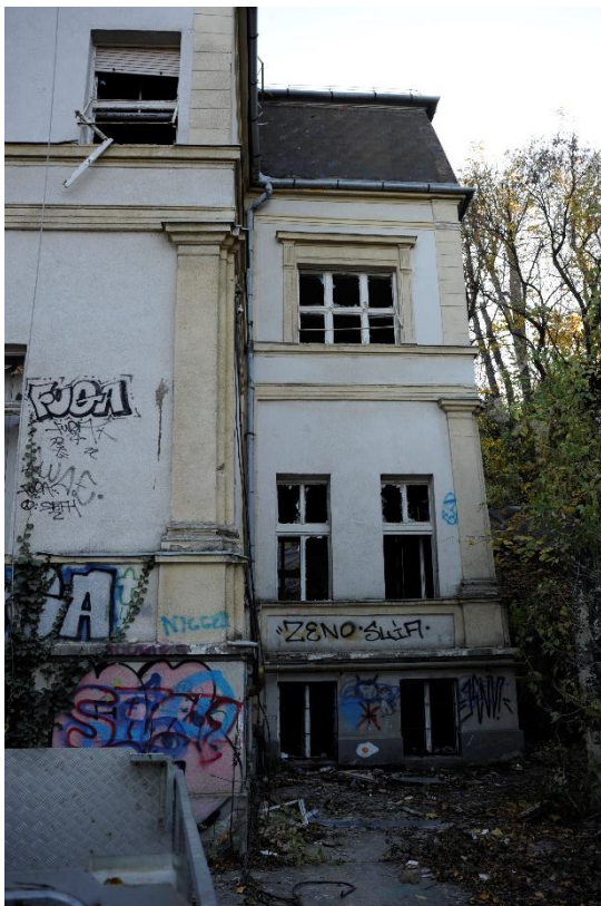
5. kép Északi homlokzat, nyugati rész