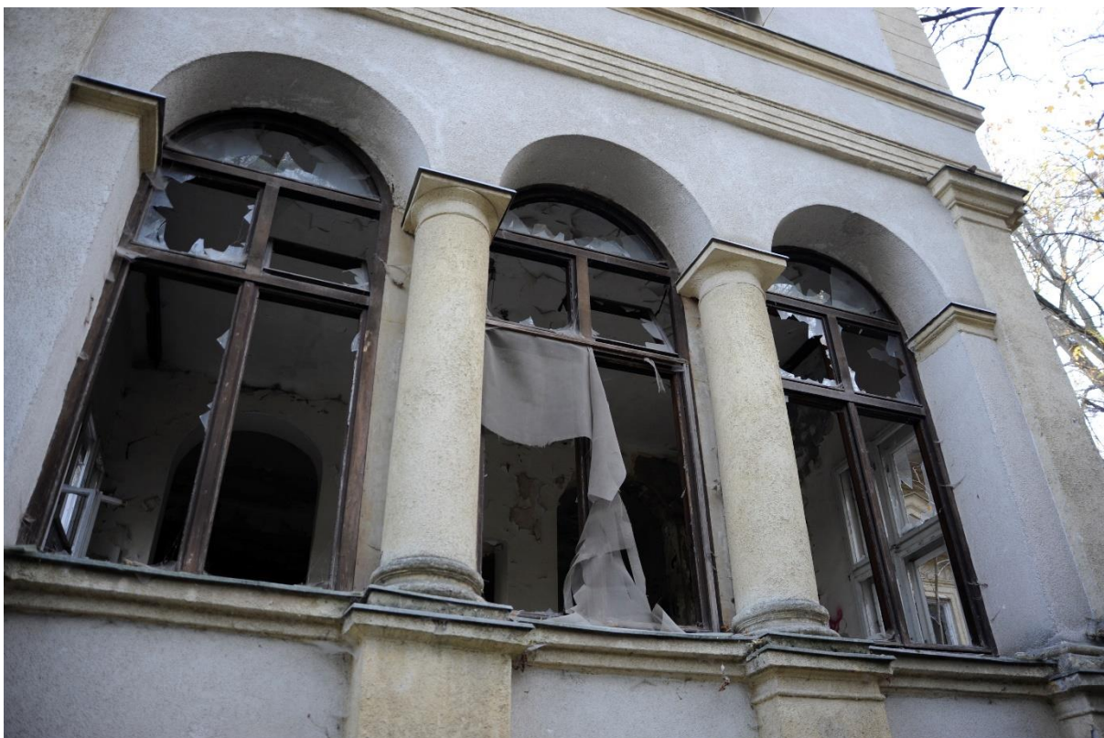
7. kép Nyugati homlokzat, részlet