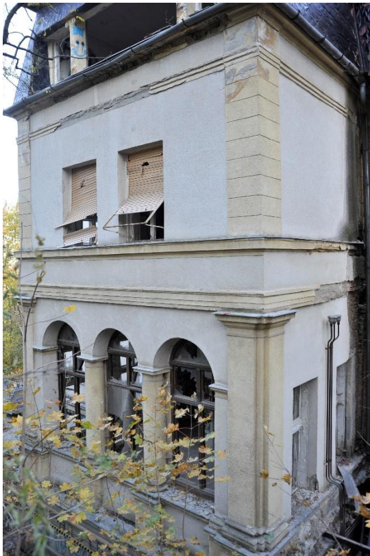
12. kép Nyugati homlokzat az utca felől, részlet