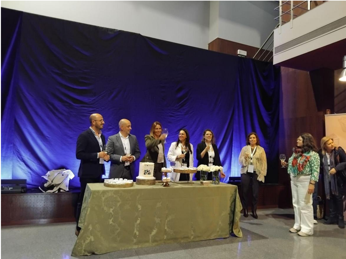
1. kép: A felgueirasi partnertalálkozón az UNIDAS program 5. éves működését is ünnepeltük

Az UNIDAS4EU projekt első személyes partnertalálkozására Felgueirasban, a vezető partner városában került sor. A kétnapos program egyszerre szolgálta a projektindításhoz kapcsolódó szakmai egyeztetést, a portugál UNIDAS-modell részletes megismerését, valamint a projektpartnerek közötti személyes kapcsolatépítést. A találkozó külön jelentőségét adta, hogy egybeesett az UNIDAS modell működésének ötödik évfordulójával, ezért a programot a helyi és térségi szereplők részéről is nagy érdeklődés kísérte. Az első nap szakmai eseményei a Casa das Artes színháztermében zajlottak, míg a második napon a Museu Casa do Assento adott helyet a kerekasztal-beszélgetéseknek, a műhelymunkának és a konzorciumi egyeztetésnek.