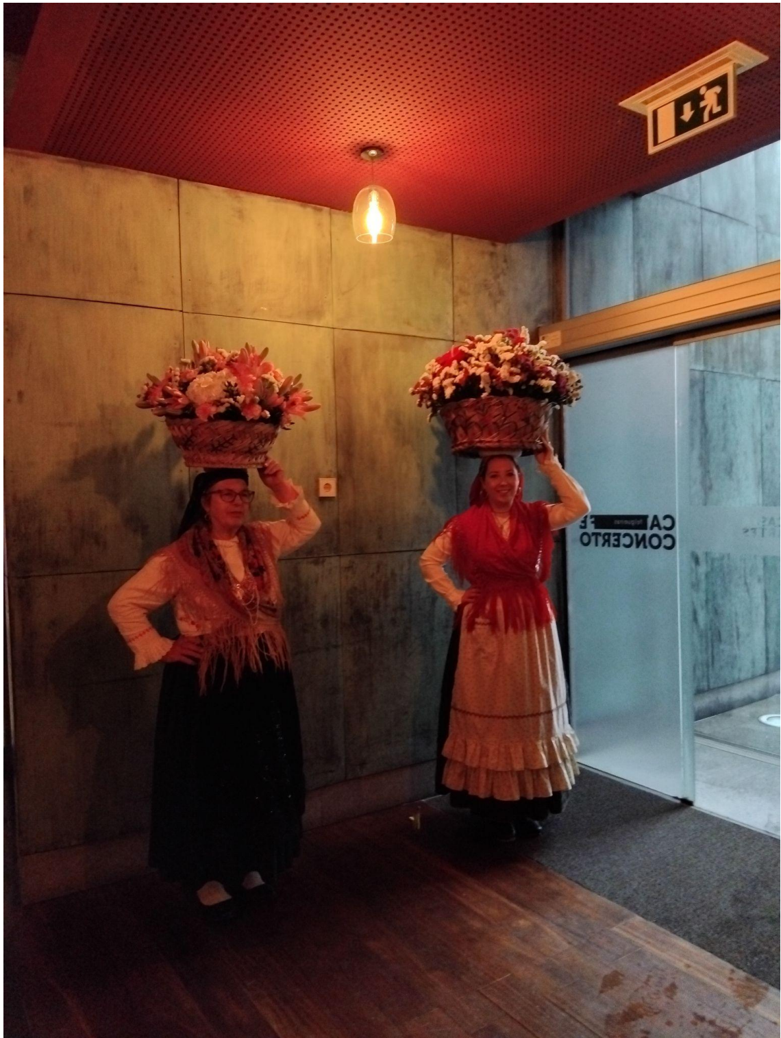
4. kép: Portugál népviselet