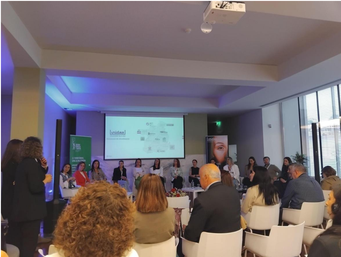
5. kép: Kerekasztal-beszélgetés a helyi ULG szereplőivel és a portugál együttműködési protokoll bemutatása

A második napon a helyi URBACT Local Group tagjaival folytatott kerekasztal-beszélgetés állt a középpontban. A portugál partnerek a területi együttműködési protokollt és az intézményközi munkamegosztást mutatták be. A beszélgetés során a résztvevők nem általános intézményi leírásokat hallhattak, hanem strukturált módon ismerték meg az egyes szervezetek szerepét, feladatait és kapcsolódási pontjait. A résztvevők között szerepeltek többek között egészségügyi intézmények, az ügyészség, az igazságügyi orvosszakértői intézet, a gyermekvédelem, a reintegrációs és büntetés-végrehajtási szolgálat képviselői.