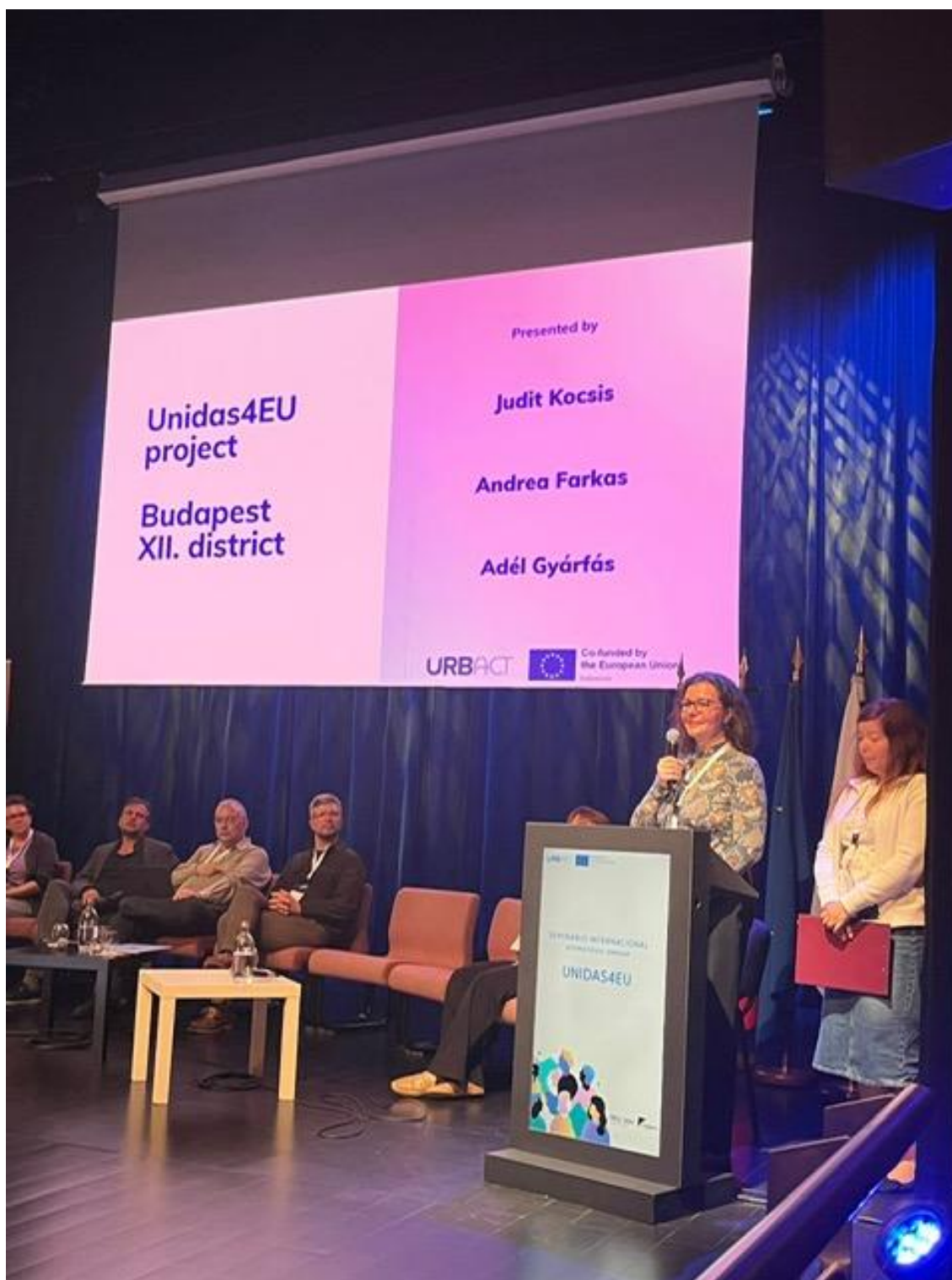
3. kép: Budapest Főváros XII. kerületének bemutatkozó előadása az UNIDAS4EU partnertalálkozáson.

A budapesti XII. kerület bemutatkozása a helyi áldozatvédelmi és jelzőrendszeri működésre, a meglévő intézményi kapcsolatokra, valamint azokra a hiányokra irányította rá a figyelmet, amelyek a portugál modell adaptációja szempontjából különösen fontosak. A partnerek prezentációi alapján a projekt közös tanulási tere nem homogén rendszerek között jön létre: egyes városokban már erősebb intézményi koordináció működik, máshol a kapcsolatok inkább informálisak vagy személyfüggők. Ez a különbség a későbbi transzfertervezés során meghatározó tényező lesz.