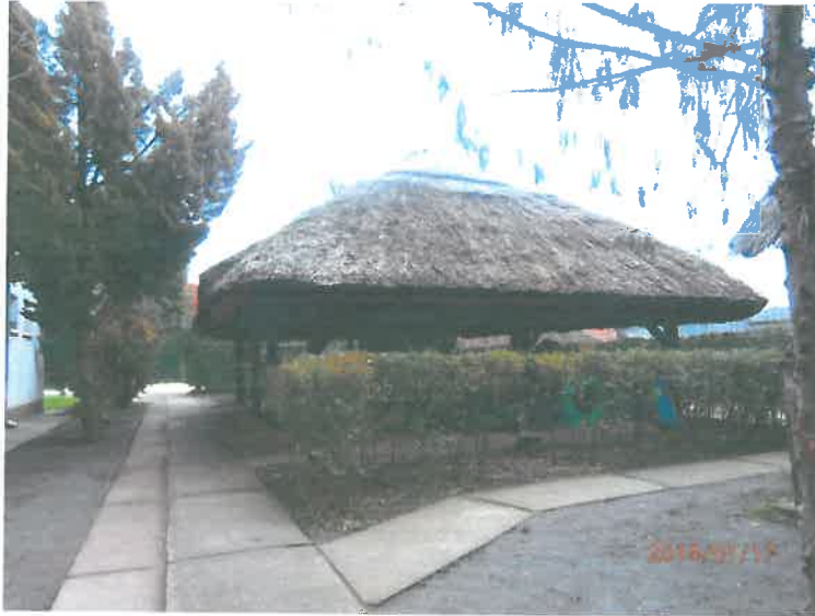
Szaletli az udvaron a nyári programokhoz

Az udvar parkosított: dús növényzet, magas árnyat adó fák, borostyánnal futtatott kerítés jellemzi. Nagy terasz és nádtetős szaletli ad lehetőséget nyáron a kinti étkezéseknek, beszélgetéseknek, családi együttléteknek.