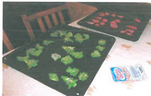
Az elkészült gyermeki finomságok☺

Az ünnep azonban nem lenne teljes közös éneklés és ajándékozás nélkül.