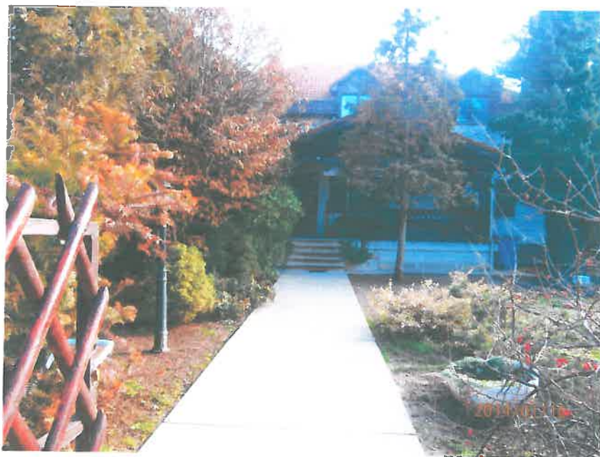
Intézményünk kapuján belépve lakóink otthonra lelnek

Intézményünk megközelíthetősége kiváló, ami a munkába járást könnyíti meg lakóink számára. Ez nem csupán abból ered, hogy Érd a főváros vonzáskörzetében található, hanem fontos tényezőként otthonunk közel van az M7-es autópályához, amin közlekedő buszjárat gyakran és gyorsan juttatja el lakóinkat Budapestre, valamint a közeli településekre. Óvoda, iskola, bolt, felnőtt és gyermekorvosi rendelő, gyógyszerár, posta, stb. van az intézmény közelében.