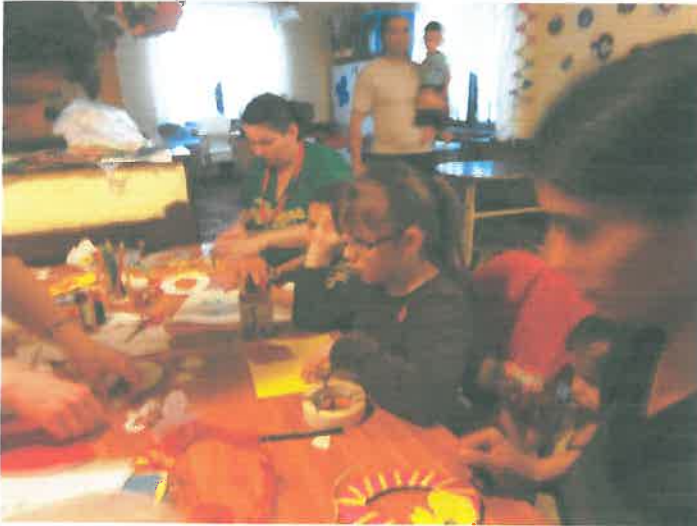
Készülnek a húsvéti díszek a falra

Fontosnak tartjuk, hogy a családok minél inkább sajátjuknak érezzék az ünnepet, ezért igyekszünk minél nagyobb szerephez juttatni a szülőket. Felügyelettel és segítséggel ugyan, de a szülők feladatává válik az várakozásban való aktív részvétel: az előkészületek, a díszítésben való segédkezés, a finomságok elkészítése is. Mindezt azért, hogy a gyerekekkel való örömteli együttlét megéléséhez vezessük el a családokat.