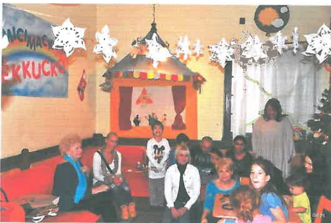
A Boldogság Klub látogatása

Decemberben az érdi Boldogság Klub látogatott el hozzánk, akik az örömteli együttléten túl élelmiszer adománnyal is támogatták családjainkat. A gyerekek pedig énekeltek és táncoltak a vendégeknek. Az együtt lét olyan jól sikerült, hogy a továbbiakban rendszeressé kívánjuk tenni.