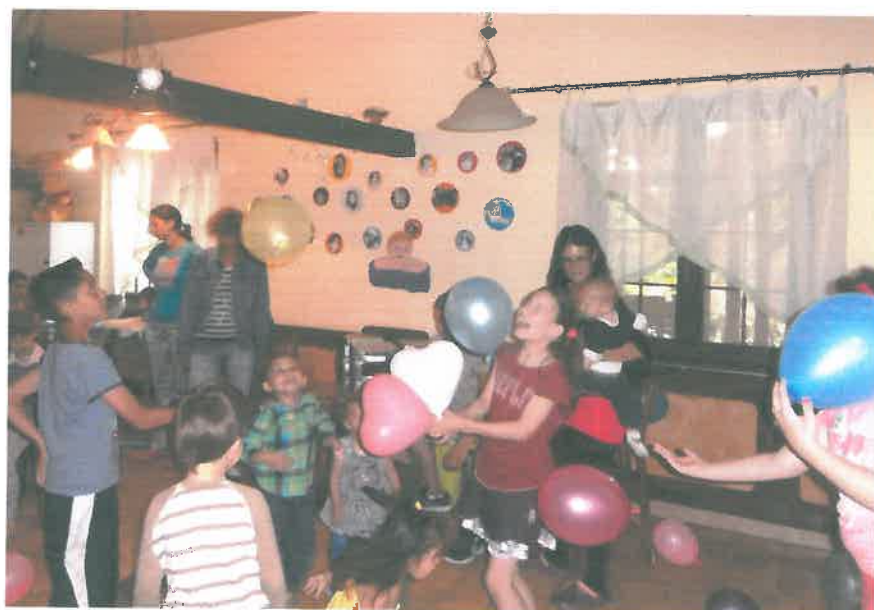
A lufi mindig jó játék