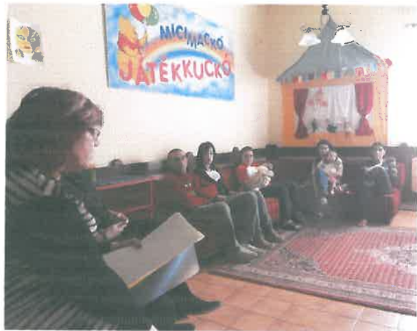
Vendégségben az óvónők