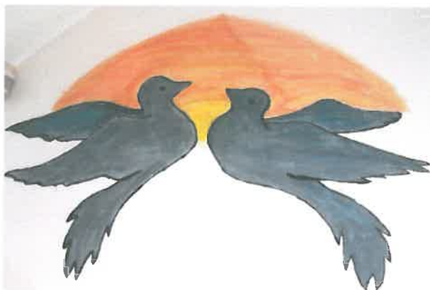
Gyermekek alkotásai a falon