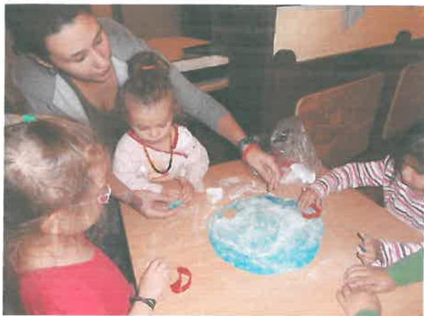
A gyerekek is segítettek a karácsonyi sütemények készítésében

A karácsonyi előkészületekből kicsik és nagyok egyaránt kivették a részüket. Terveztek, díszítettek, a gyerekek műsorral készültek és közösen főztek. Még az apróságok is komoly arccal szaggatták a süteménytészta a nagy napra.