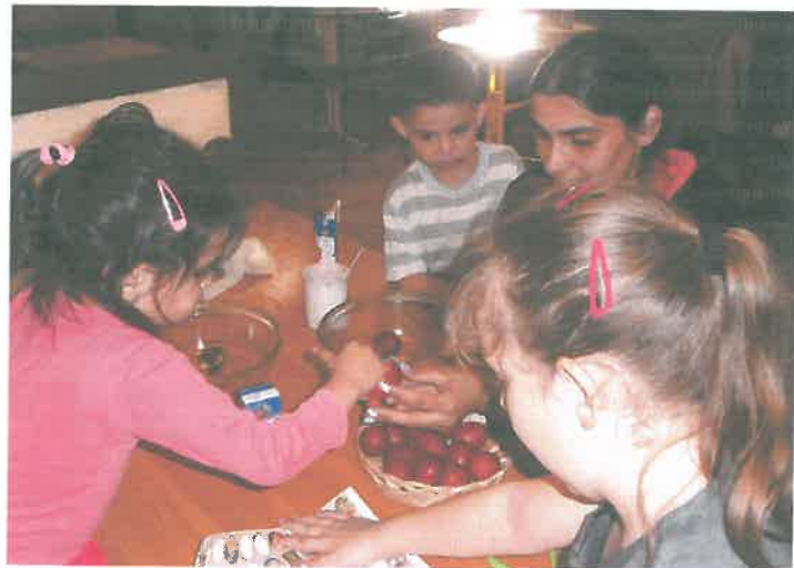
Húsvéti tojásfestés anyával