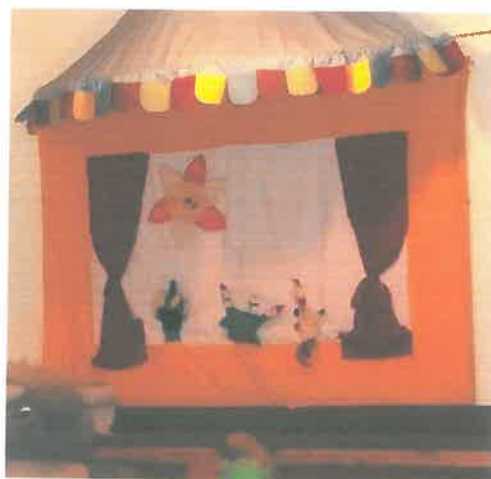
Szülők által varrt bábszínház