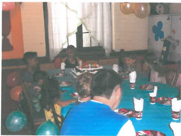
Együtt az asztalnál

Rendszeresen megünnepeljük a születésnapokat. A torta nemcsak az ünnepelt öröme☺