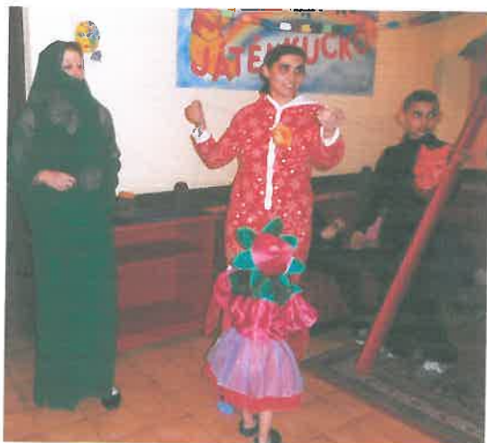
A felnőttek is beöltöztek

A farsang a bolondozások és a tánc ideje. Ilyenkor a szülők is bátrabban kerülnek vicces szituációkba: beöltöznek és együtt játszanak a gyermekekkel.