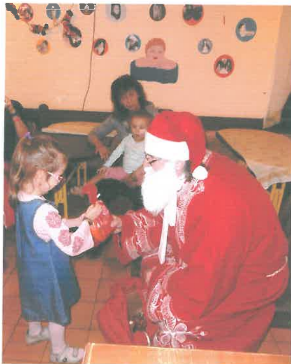
Van zsákodban minden jó...

Idén két Mikulás is ellátogatott hozzánk kedves segítő önkéntesek által. A gyermekek percről percre fokozódó izgalommal várták, meghallják-e a száncsengő hangját. A fiatalok félénkebben, a nagyobbak már bátrabban mentek az ajándékért, és énekeltek, verset mondtak a nagyszakállú Mikulásnak.