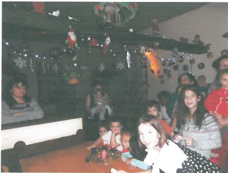
Adventi gyertyák fényében

A várakozás időszakát is minden évben megünnepeljük. Vasárnaponként beszélgetéssel, énekekkel, versekkel és gyertyagyújtással tesszük emlékezetessé az adventet.