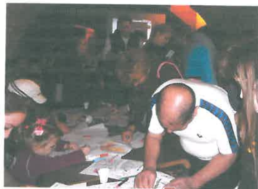
Együtt rajzol a család az önkéntes napon