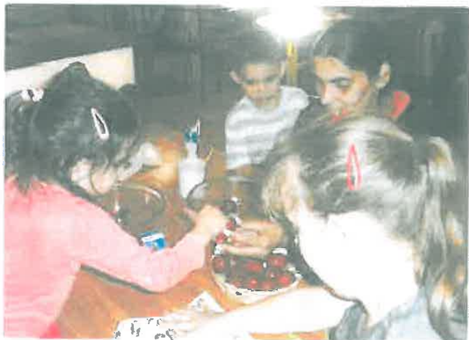
Húsvéti tojásfestés anyával