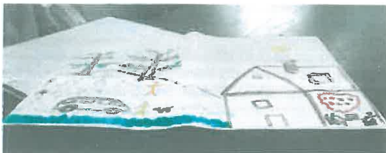
Az álom valósággá válhat

A családoknak lehetőséget nyújt a nálunk eltöltött idő arra, hogy mind mentálisan, mind anyagilag megerősödjenek.