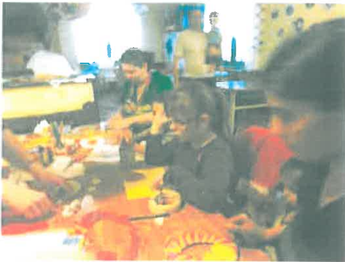
Készülnek a húsvéti díszek a falra

Fontosnak tartjuk, hogy a családok minél inkább sajátjuknak érezzék az ünnepet, ezért igyekszünk minél nagyobb szerephez juttatni a szülőket. Felügyelettel és segítséggel ugyan, de a szülők feladatává válik az várakozásban való aktív részvétel: az előkészületek, a díszítésben való segédkezés, a finomságok elkészítése is. Mindezt azért, hogy a gyerekekkel való örömteli együttlét megéléséhez vezessük el a családokat.