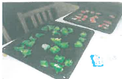
Az elkészült gyermeki finomságok☺

Az ünnep azonban nem lenne teljes közös éneklés és ajándékozás nélkül.