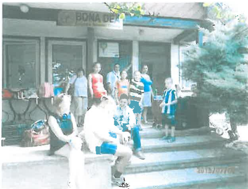
Intézményünk kapuján belépve lakóink otthonra lelnek

Intézményünk megközelíthetősége kiváló, ami a munkába járást könnyíti meg lakóink számára. Ez nem csupán abból ered, hogy Érd és Diósd a főváros vonzáskörzetében található, hanem fontos tényezőként otthonunk közel van az M7-es autópályához, illetve a 70-es úthoz amin közlekedő buszjárat gyakran és gyorsan juttatja el lakóinkat Budapestre, valamint a közeli településekre. Óvoda, iskola, bolt, felnőtt és gyermekorvosi rendelő, gyógyszertár, posta, stb. van az intézmény közelében.