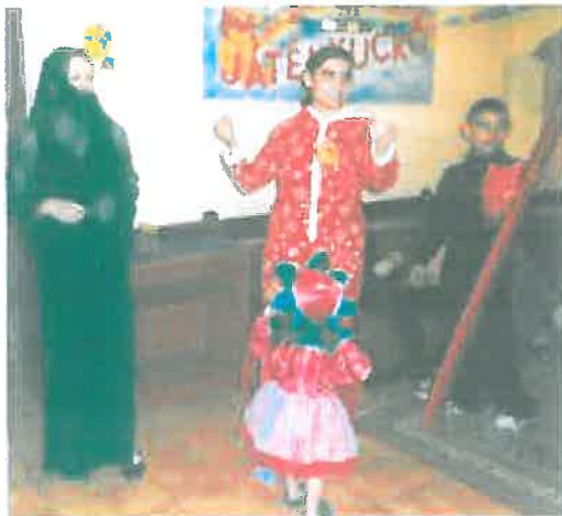
A felnőttek is beöltöztek

A farsang a bolondozások és a tánc ideje. Ilyenkor a szülők is bátrabban kerülnek vicces szituációkba: beöltöznek és együtt játszanak a gyermekekkel.