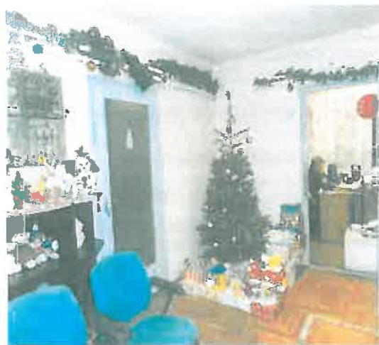
Pest Megyei Kormányhivatal munkatársai gyűjtöttek ajándékot.