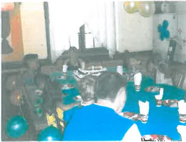
Együtt az asztalnál

Rendszeresen megünnepeljük a születésnapokat. A torta nemcsak az ünnepektől öröme 😊