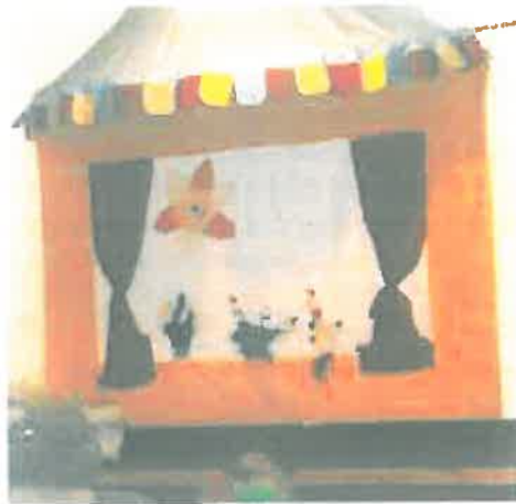
Szülők által varrt bábszínház