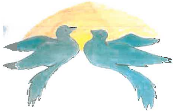
Gyermekek alkotásai a falon