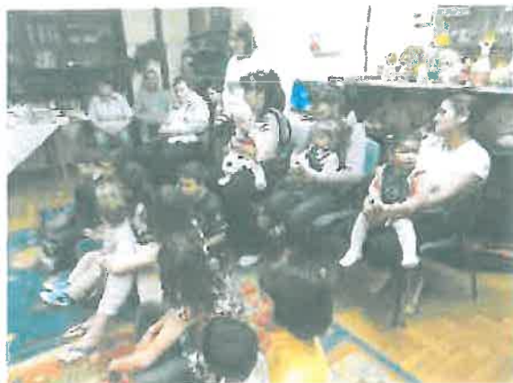
közös karácsonyi ünnep

A karácsonyi előkészületekből kicsik és nagyok egyaránt kivették a részüket. Terveztek, díszítettek, a gyerekek műsorral készültek és közösen főztek. Még az apróságok is komoly arccal szaggatták a süteménytészta a nagy napra.