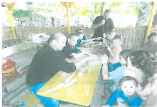
Népi hangszer készítés

A felnőttek sem maradnak ki a közösségi életből. Közös főzésekkel, szülői fórumokkal, az ünnepek megtartásával, az előkészületekben és az eseményeken való aktív részvétellel erősödik az „együtt” érzése, így formálódnak a családok lakóközösségé. Támogatjuk a családok minden olyan kezdeményezését, ami a közösségi életet erősíti.