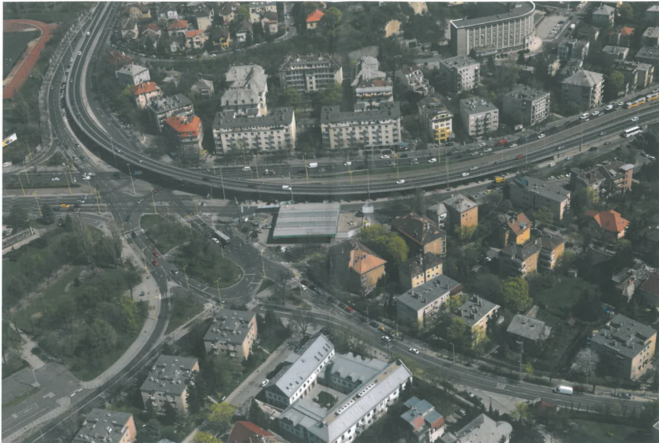
Készült: 2013 Délről északi irányba repülés. Képszám:D-E-006