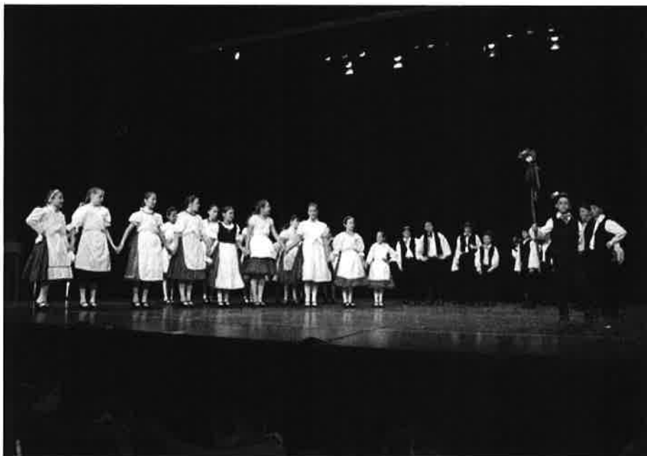
Hegyvidéki Néptánc Találkozó