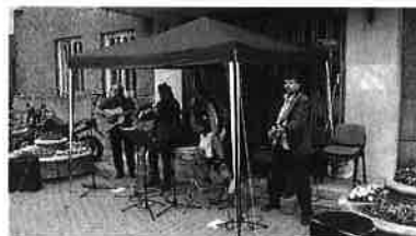
A M.É.Z. együttes

Zenés programjaink a Városháza téren szerveződtek, a sorozat májusban és szeptemberben zajlott 4-4 alkalommal, többnyire népzenei együttesek közreműködésével. Kézműves foglalkozásokat és a Szamos Marcipán Kft. támogatásának köszönhetően marcipángyurmázási lehetőséget is kínáltunk a gyerekeknek számára. Ezen kívül alkalmanként kirakodóvásár, népi körhinta, valamint arcfestés bővítette a programok választékát. A rendezvényeken 100-150 fő vett részt átlagosan. A kerületi nyugdíjasok ingyenes kávéjegyeket kaptak, amelyeket a rendezvényen válthattak be.