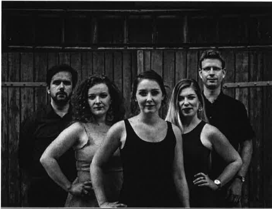
A Jazzation énekegyüttes