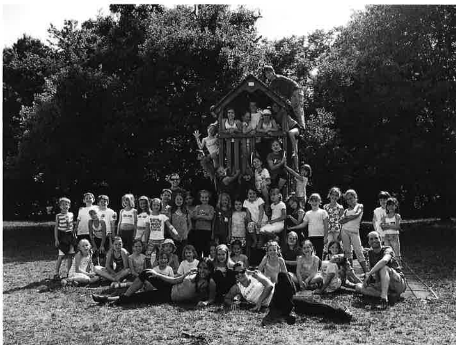
Akrobatikus Rock and roll tábor

zítés legfontosabb lépéseivel, miközben kipróbálhatták magukat a versírásban és az illusztrációkészítésben is. A Virányosi Községi Ház munkatársai a kerületi iskolák nyári táborának kulturális programjait állították össze az elmúlt három évben.