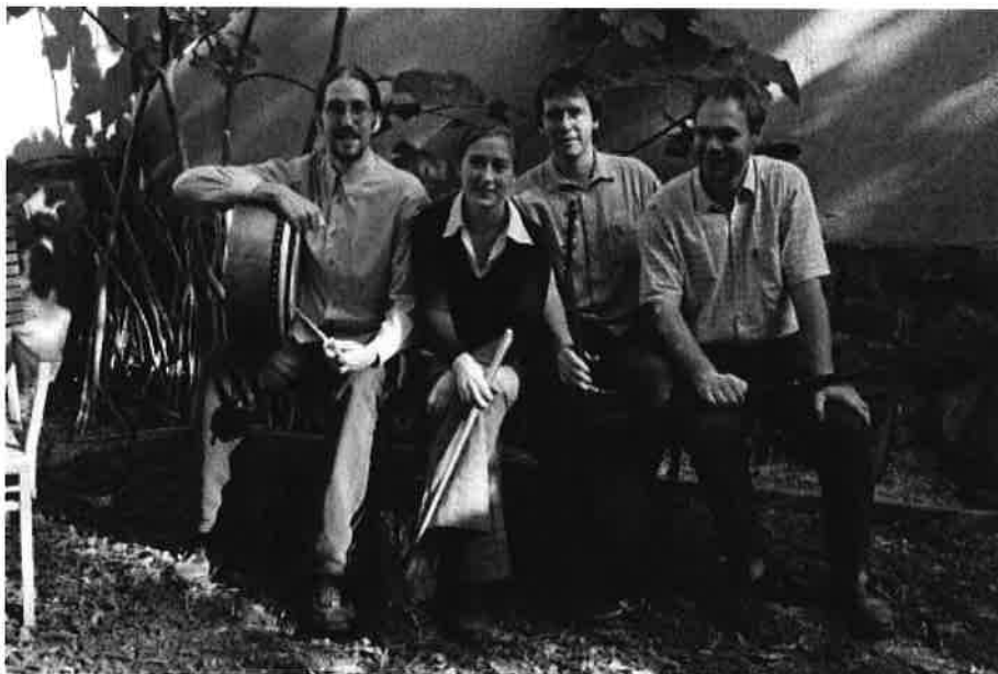
A Bran együttes

Eddigi profilunknak megfelelően, elsősorban a könnyűzenei- és jazzkoncertek emelkedtek ki kínálatunkból, melyekkel magas szintű zenei élményt kínáltunk zenekedvelő törzsközönségünknek. A koncerteken sokféle zenei stílus szerepelt, az összekötő kapocs minden esetben a minőség és az igényesség volt. Folytattuk az eddig sikeresnek, néhány esetben hagyományteremtőnek is tekinthető művészek, zenekarok felléptetését. Ilyen például a jövőre 25 esztendőős Bran együttes.