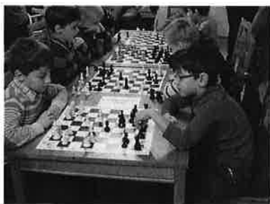
Erkel Ferenc Sakkverseny