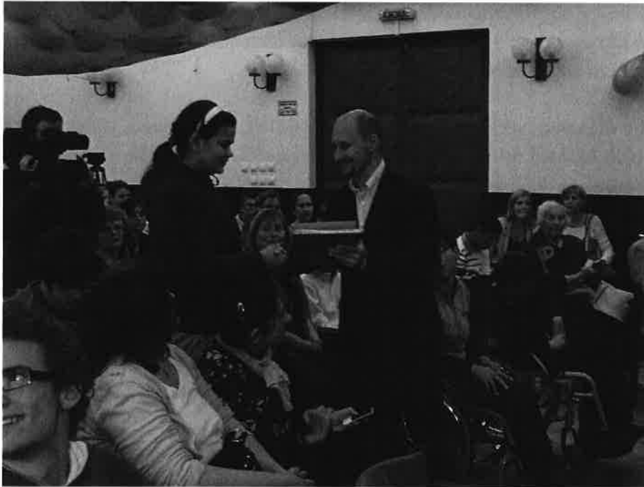
Sérült fiatalok fesztiválja

A havonta egymást váltó kiállítások némi várakozással tudnak a jelentkező művészeknek bemutatkozási lehetőséget biztosítani. Két éve ehhez csatlakozott a Lívia-villa, amely kiválóan alkalmas kiállítások megrendezésére.