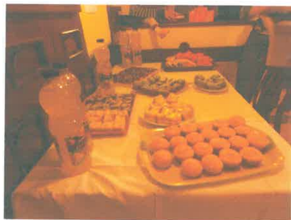
Közös főzés eredménye a karácsonyi asztalon