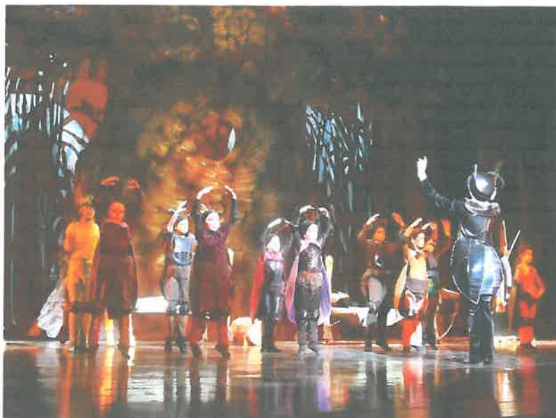
Színházlátogatás: BOGÁRMESE (Ram Colosseum)

A kisebbek szeretik a mesenézést, ami csoportos keretek között, ellenőrzött tartalommal történik. Ám az „egyszerű” mesélés valamint diafilmek és rajzfilmek mellett az óvodás és kisiskolás korosztály számára mesére épülő fejlesztő jellegű foglalkozásokat is szerveztünk. A Mesecsoport alapja a mese, mely olyan tudásanyagot közvetít, ami segíti az embert a világban való eligazodásban, a problémák kezelésében, megoldásában. Emellett mondókázás és különböző játékok is helyet kaptak a foglalkozásokon.