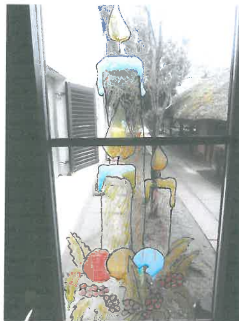
Szülő üvegfestménye az ablakon

2014-ben zárult le a TÁMOP-5.2.5. „Esély a hátrányban élőknek” pályázat , mely során lehetőséget tudtunk teremteni lakóink számára, hogy olyan élményekkel, lehetőségekkel gazdagodjanak, melyekre a hétköznapi életükben nem vagy csak kevés esélyük lett volna.