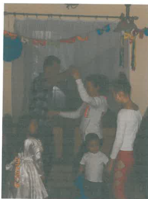
Itt a farsang, áll a bál