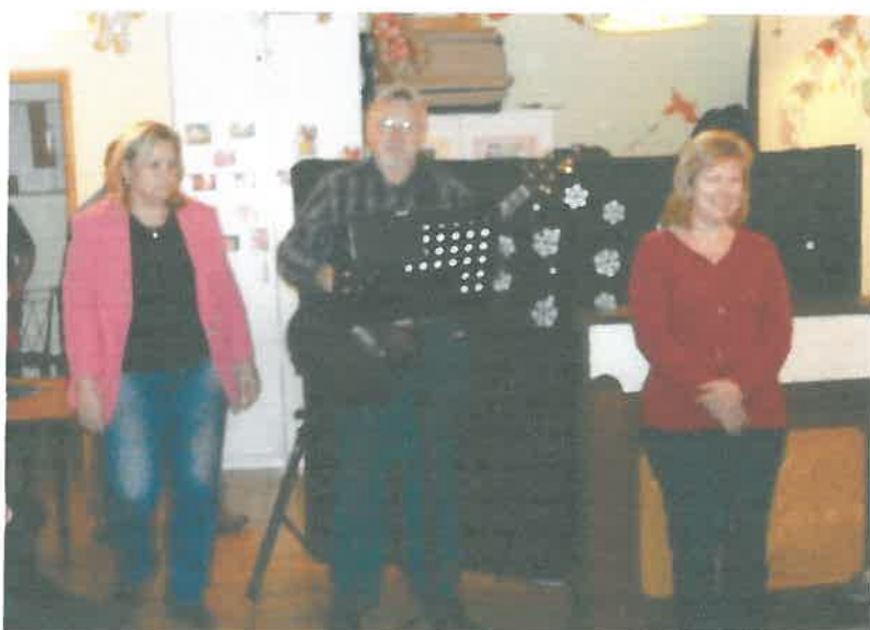
Karácsonyi zenés műsor

Nem szabad megfeledkezni a vállalatok és magánszemélyek által nyújtott segítségről sem. Bár csupán kétévnyi működés áll mögöttünk Érden, ismertségünk egyre nagyobb. Törekvéseinket elismerve és segítve számos adományt kaptunk a város több intézményétől és vállalkozóitól egyaránt, amivel családjainkat életminőségén tudunk javítani. Nagy öröm számunkra, hogy magánemberek is gyakran adományoznak lakóinknak. Emellett régi kapcsolatainkat is ápoljuk. Nagy örömet jelentett a számunkra, hogy költözésünkkel nem szűnt meg a Törökbálinthoz kötődő támogató rendszerünk. Különösen fontos ez számunkra, mert azt mutatja, hogy munkánkat elismerik és törekvéseink mások számára is fontossá váltak. Természetesen az újabb kapcsolatokat is folyamatosan építjük. A Vöröskereszt, a Szent Erzsébet Karitászi Központ, az Élelmiszerbank, az Ága-Boga Nagycsaládosok Érdi Egyesülete és baráti társaságok is ügyünk mellé álltak: ajándékok gyűjtésével valamint zenés, mesés műsorral tették örömtelivé gyermekeink karácsonyát.