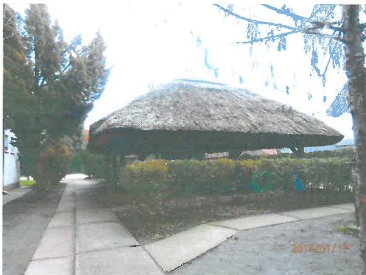
Szaletli az udvaron a nyári programokhoz

Az udvar parkosított: dús növényzet, magas árnyat adó fák, borostyánnal futtatott kerítés jellemzi. Nagy terasz és nádtetős szaletli ad lehetőséget nyáron a kinti étkezéseknek, beszélgetéseknek, családi együttléteknek.