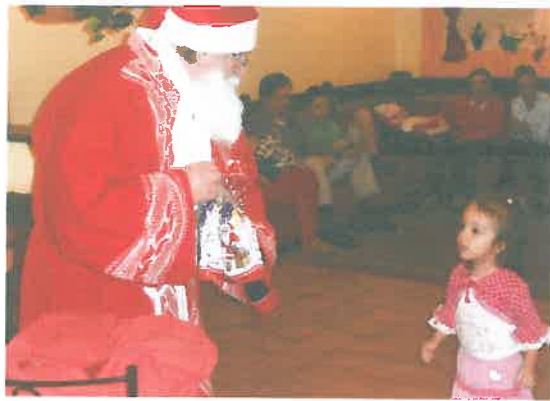
„Van zsákodban minden jó”