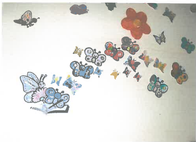
Gyermekek alkotásai a falon

Nemcsak a ház körül, de az intézmény falain belül is igyekszünk az esztétikumot a lakók igényévé tenni: lakóinkkal közösen apró dísz tárgyakat készítünk, melyekkel otthonosabbá tesszük a helyiségeket, valamint a gyermekek és az ügyes kezű felnőttek alkotásaival díszítjük a falakat. Tapasztalatunk szerint a saját erőből készített tárgyak, díszek értéke megnő, ezáltal nemcsak kedvet kapnak saját szobájuk díszítésére is, de egyben jobban vigyáznak az elkészült művekre lakóink.