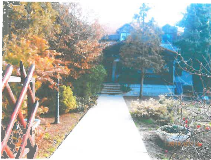
Intézményünk kapuján belépve lakóink otthonra lelnek

Intézményünk megközelíthetősége kiváló, ami a munkába járást könnyíti meg lakóink számára. Ez nem csupán abból ered, hogy Érd a főváros vonzáskörzetében található, hanem fontos tényezőként otthonunk közel van az M7-es autópályához, amin közlekedő buszjárat gyakran és gyorsan juttatja el lakóinkat Budapestre, valamint a közeli településekre. Óvoda, iskola, bolt, felnőtt és gyermekorvosi rendelő, gyógyszertár, posta, stb. van az intézmény közelében.