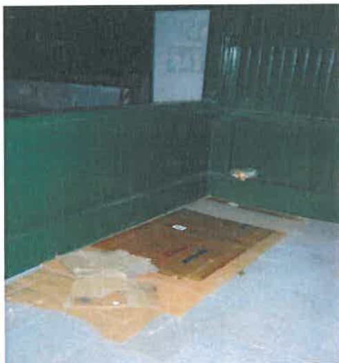
Fogaskerekű végállomása, peron (Széchenyi- hegy)

Új helyszínünk volt ebben az évben a Rege park , ahol egy pár ütött sátrat. Őket sikerült egy lakhatási program keretében munkásszállóra költöztetni, így jelenleg a parkban már nem laknak.