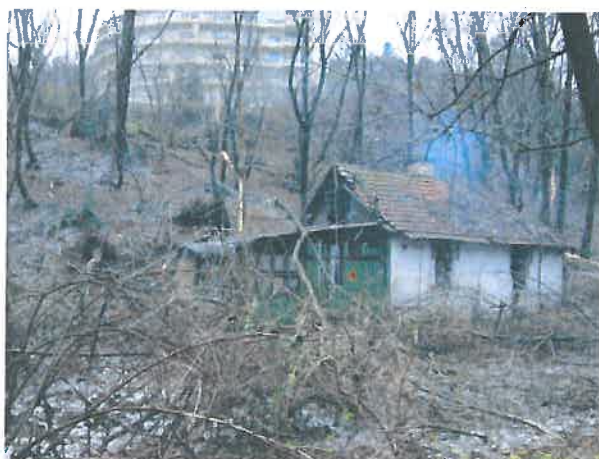
Mártonhegyi út melletti erdős terület