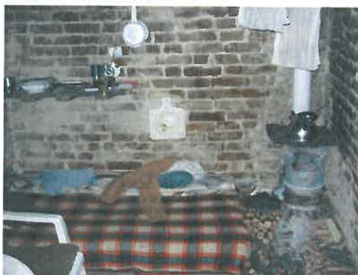
Virágvölgy, régi, romos erdészház belülről