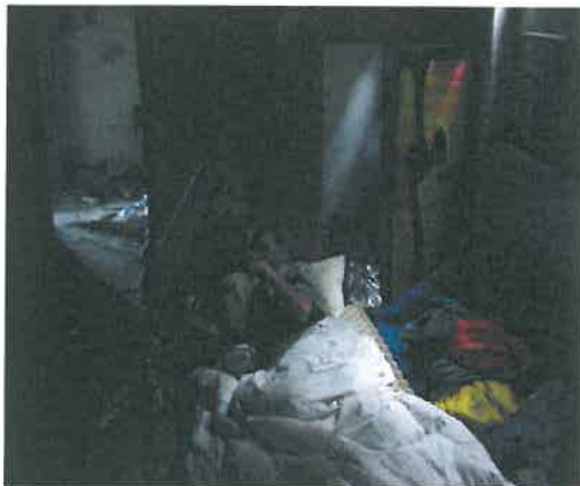
Zugliget, Lóvasút romos épületében