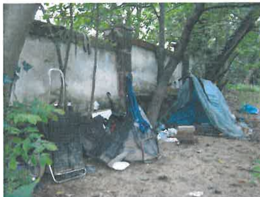
Gyógyfű utca, bokros-fás sáv, sátrak