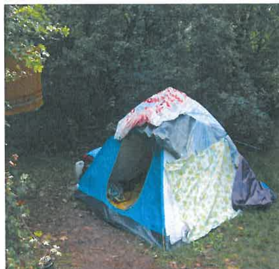
Széchenyi-hegy, Rege Park, sátor