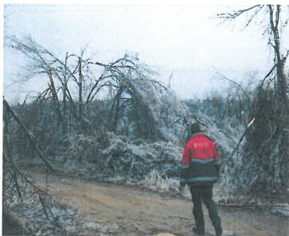
Sötétvágás utca melletti erdős terület

A katasztrófa-helyzetről, a Szolgálatunk által készített néhány kép: