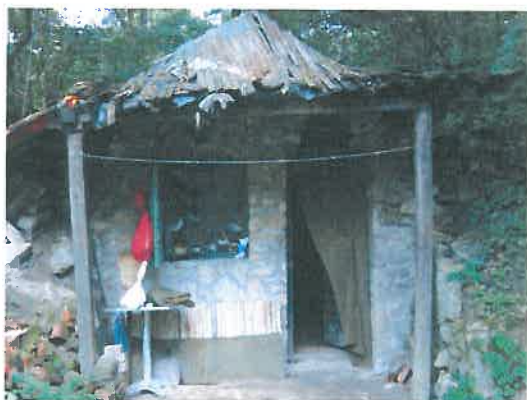
Virágvölgy, régi, romos erdészház kívülről

A terület adottságaiból, méreteiből fakadóan folyamatos felderítésre szorul. Időszakosan két-három fő még megfordul itt, de csak éjszakánként, és nem tartósan.