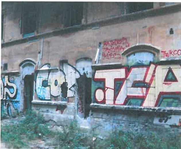
Zugliget, Lóvasút romos épülete kívülről

Zugligetben főként elhagyott, romos házakban laknak a gondozottaink. Ebben az évben új helyszín lett a Lóvasút romos épülete: a házba egy általunk még nem ismert hajléktalan pár költözött be ebben az évben, ill. egy régi gondozottunk költözött át ide. Az épületben emellett – térképezéseink során - kábítószer-használatra utaló eszközöket találtunk.