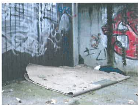
Gyógyfű utca, garázsor előtt