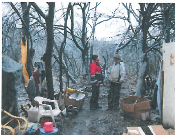
Sötétvágás utca melletti erdős terület