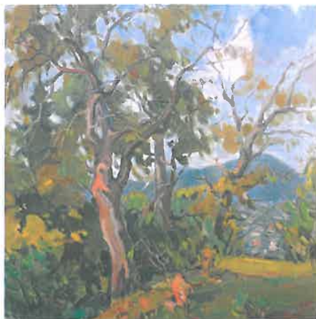
Villásek Tibor: „Normafa” 2015

Augusztus 19-én érkeztek a művészek Budapestre, 20-án, egy esős napon megtekintették a kerület építészeti értékeit: a Világok Királynője kápolnát a Normafán, Aba-Novák Vilmos freskóit és Sztehlo Lili üvegablakait a Városmajori templomban, majd a templomhoz tartozó harangozótorony tetejéről láthatták a kerületünk körpanorámáját. Ezután ellátogattak a Barabás Villába, az Erzsébet-kilátóhoz és a Lóvasút végállomáshoz, majd megnézték a Hegyvidék jellegzetes fa oromzatú épületeit. A művészek vázlatokat és fotókat készítettek, melyeket később az alkotómunka során felhasználtak. Az alkotóknak módjuk volt bejárni a kerület kiemelten fontos kulturális színtereit is.