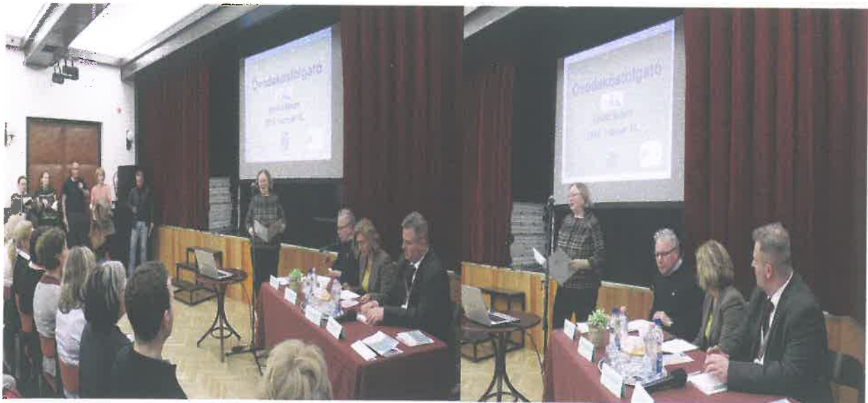
Hunniareg, Pedagogiai Intézet Fejlesztő Kft. Székhely és irodahelyi cím: 4033 Derecsény, Japán u. 9. Kontaktinformáció: hunniareg.hu; Web: www.basniareg.hu