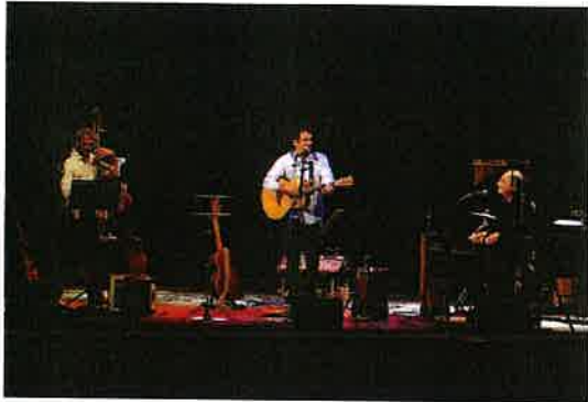
A Cseh Tamás Projekt

lincselő előadást élvezhetett a közönség. A Hot Jazz Band minden bizonnyal a legjelentősebb fellépőnk volt 2017-ben. A november 25-i koncertet már hetekkel előbb nagy érdeklődés övezte, a zenekar kedvelői pedig nagyon kellemes estét tölthettek kedvenceikkel egy igazán családias, közvetlen hangulatú, ugyanakkor hibátlanul professzionális előadáson.