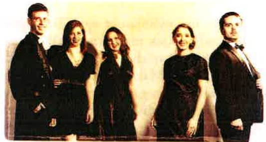
A Jazzation énekegyüttes

A közönségszervezés során több előadás előtt is szerveztünk fizetett Facebook reklámkampányt. Akár híve valaki a népszerű közösségi oldal működésének, akár nem, kétséget kizáróan az egyik leghatékonyabb