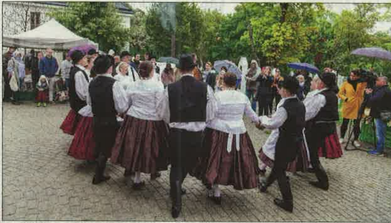
A soroksári táncgyűttes

élet és az Úristen szeretetének tisztaságát próbáljuk közvetíteni” – mondta a nővér.