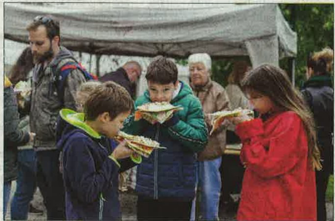
Nagy sikere volt a kovászos kenyérlángosnak