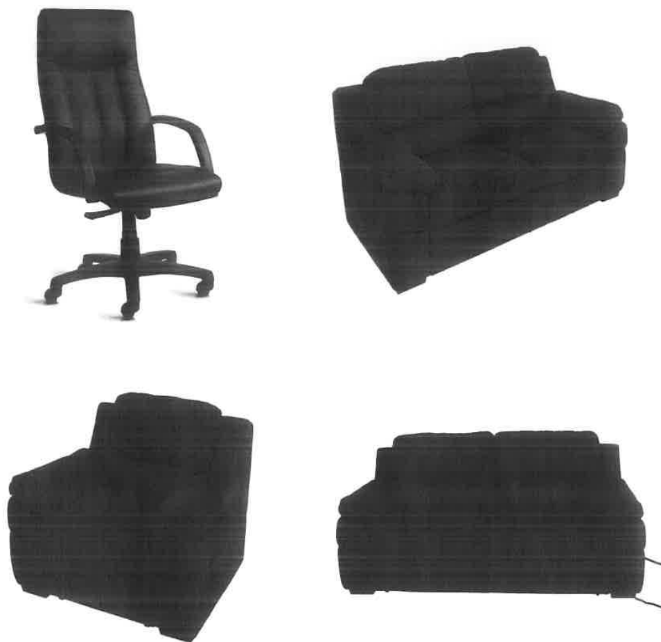
1. kép A Budavári KÖ. ülögarnitúrája, bútorai

2. A II. kerületi Hivatásos Tűzoltó Parancsnokság (továbbiakban II. HTP) pihenőhelyiségének, konyha helyiségének fejlesztése többek között konyhai eszközök, felszerelések, gépek, beszerzése, a rajparancsnoki irodába klíma felszerelése, a II. HTP helyiségeinek, kertjének karbantartása érdekében többek között ütve csavarozó, csavarbehajtó gép, benzinmotoros fűnyíró, kerti ágdaráló, kézi seprőgép, ipari porszívó, valamint nagy teljesítményű kompresszor beszerzése.