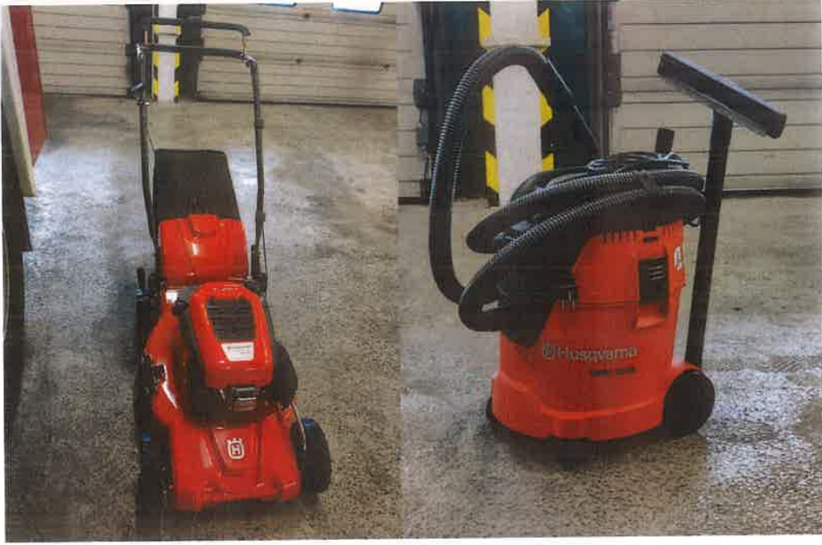
2. kép II. HTP benzinmotoros fűnyíró és ipari porszívó