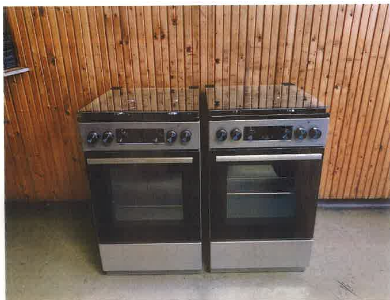
5. kép II. HTP kombi tűzhelyek