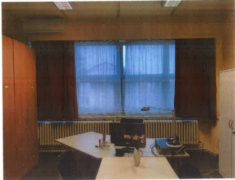
3. kép II. HTP rajparancsnoki iroda klíma berendezés