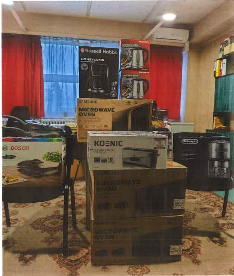
6. kép II. HTP konyhai gépek és eszközök