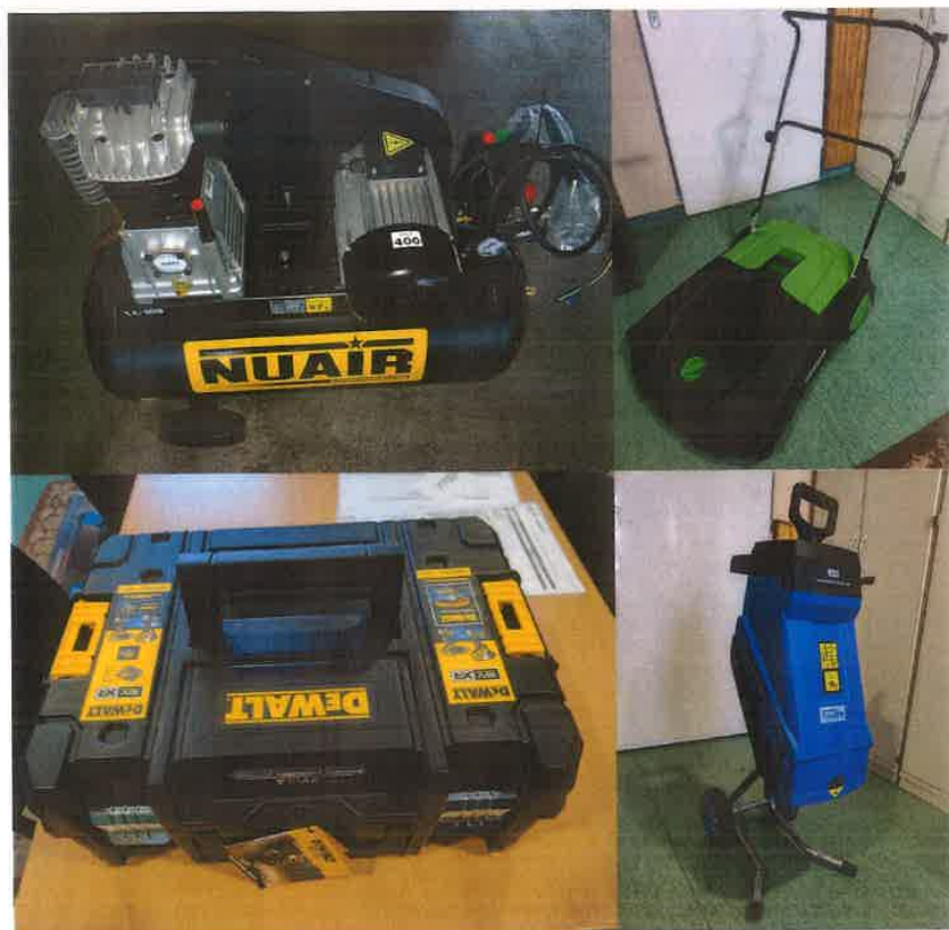
4. kép II. HTP ipari kompresszor, seprőgép, akkus szerszámcsomag, ágaprító gép