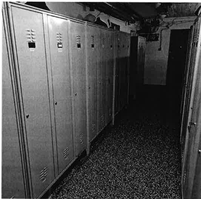
A „fekete” öltözőbe beszerzett szekrények 1. kép

A 2021-es évben Budapest Főváros XII. Kerület Hegyvidék Önkormányzata öt millió forinttal támogatta laktanyánkat. A támogatásból a beosztottak jutalmazásán felül olyan berendezéseket vásároltunk, mellyel a laktanyáinkat élhetőbbé és komfortosabbá tehetjük.