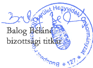
Balog Béláné bizottsági titkár