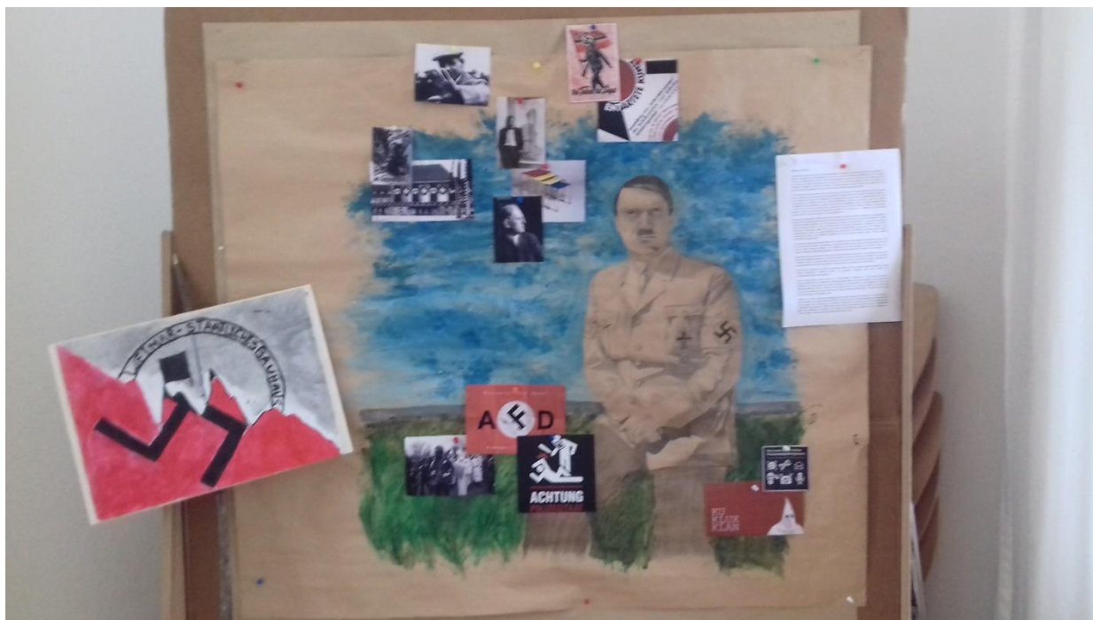
A Bauhaus és Hitler viszonya / az elkészült mű.