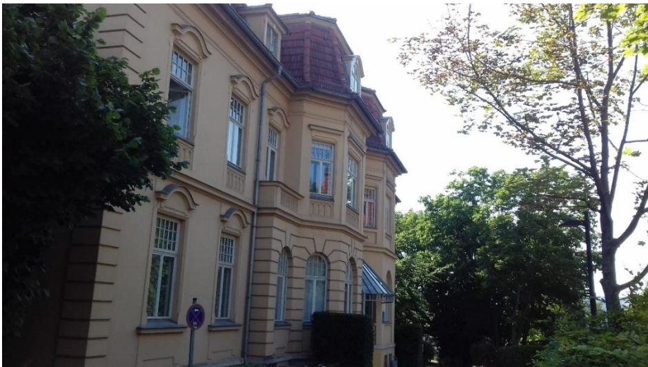
A Sárga Villa, egyik helyszínünk.