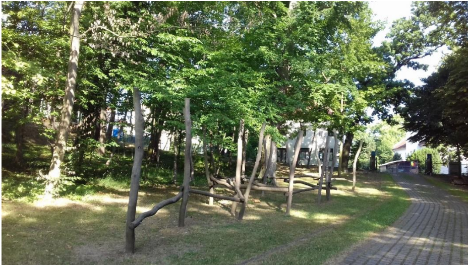
Ez az a bizonyos „kötélpálya.”