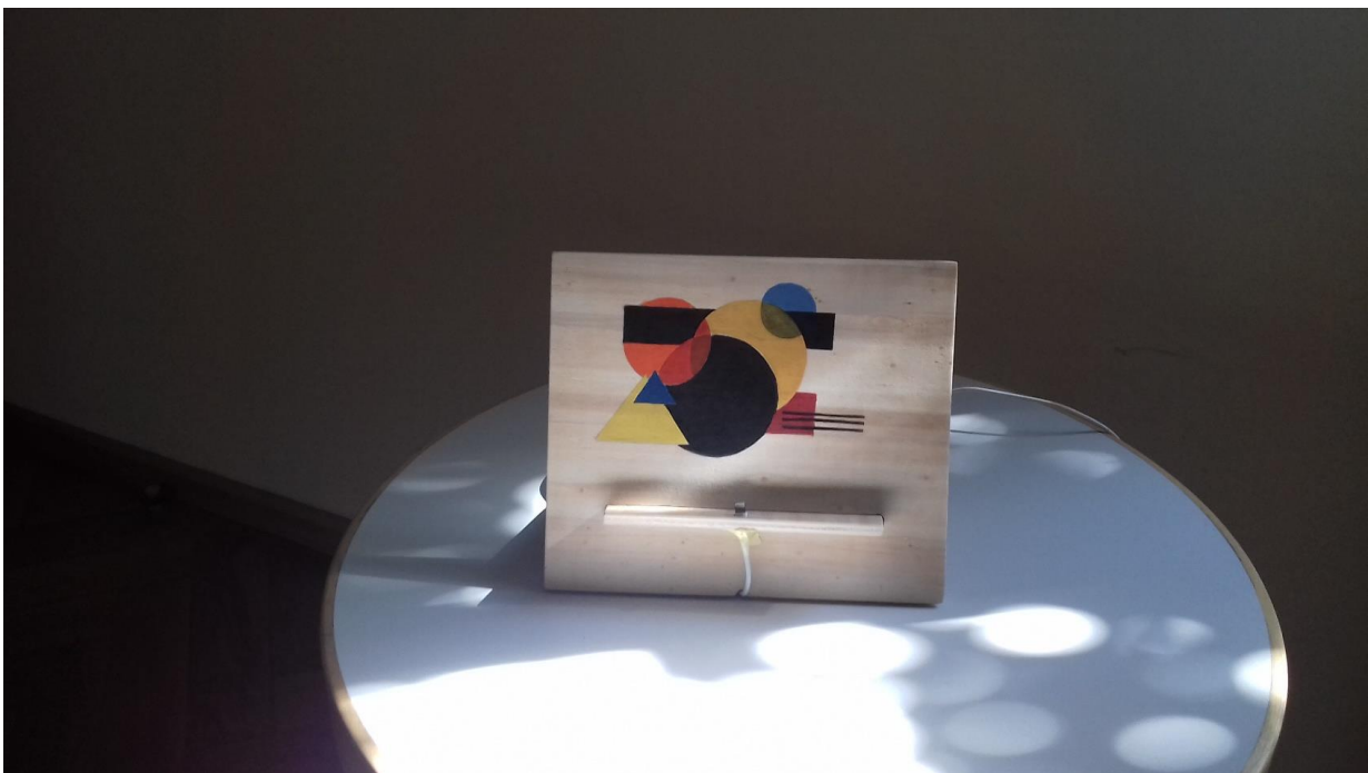
Praktikus megoldás a Bauhaus stílusában: esztétikus mobiltartó, mely segít megelőzni a töltőkábel megtörését / projektmunka