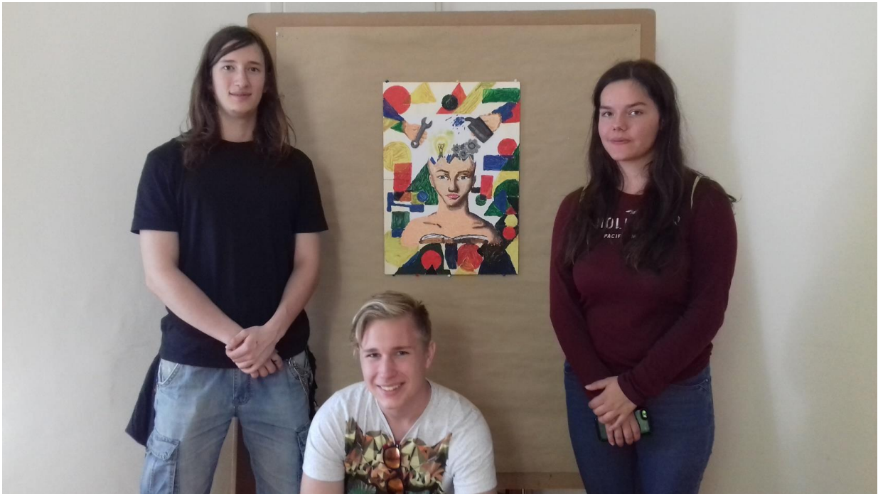
A mű „A Bauhaus és az oktatás” és alkotói