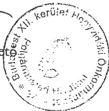
Kiss Tünde jegyzőkönyvvezető